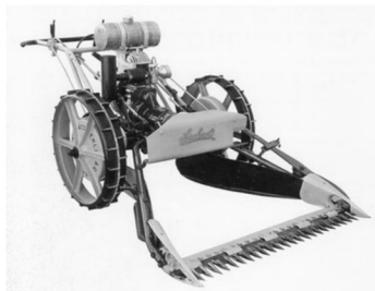
Unser Museumsschatz, die Aecherli-Mähmaschine