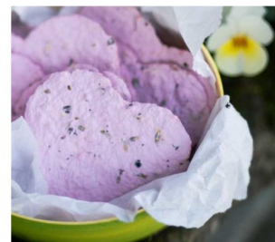
Leinsamen-Blumenpapier zum SELBERMACHEN