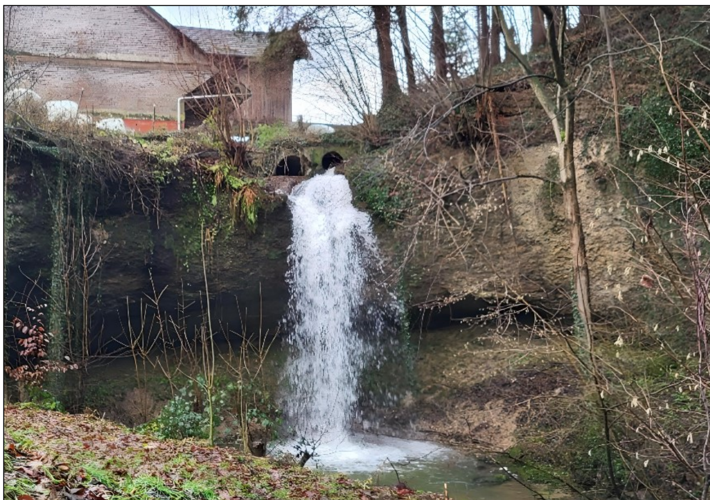
Wasserfall im Weiler Finkenbach

Seite 6 Terminkalender / ATG Business AG