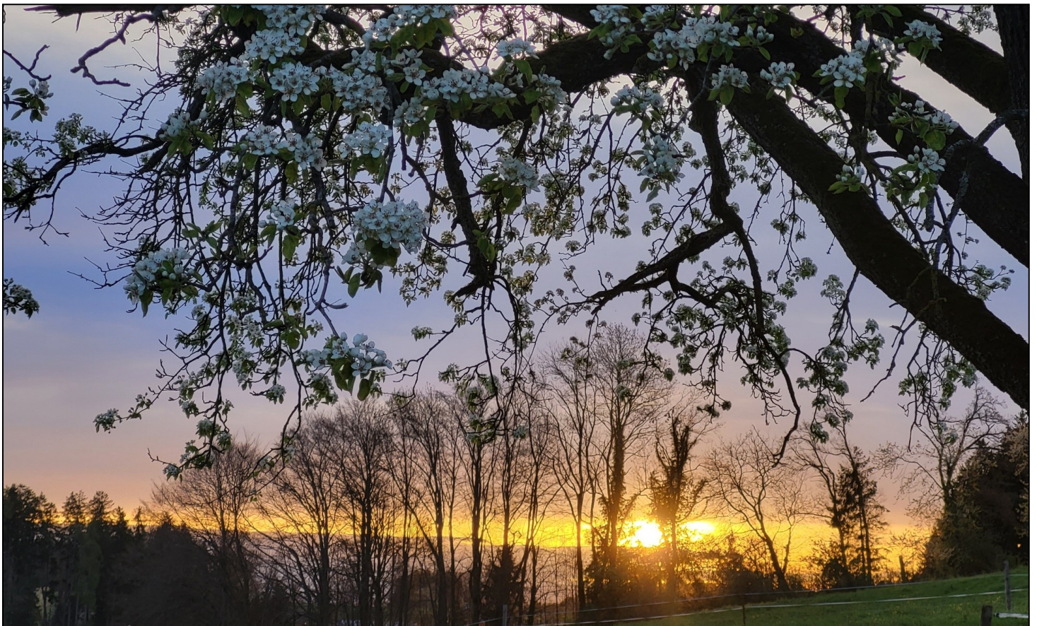
Birnbaumblüte mit Sonnenaufgang im Bremenort