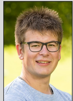
Markus Egger Zimmermann Fecker Holzbau AG