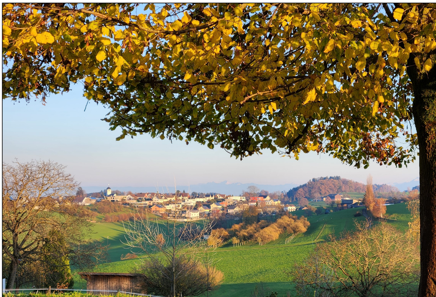
Herbstbild mit Blick vom Kollerberg Richtung Beckenstein.